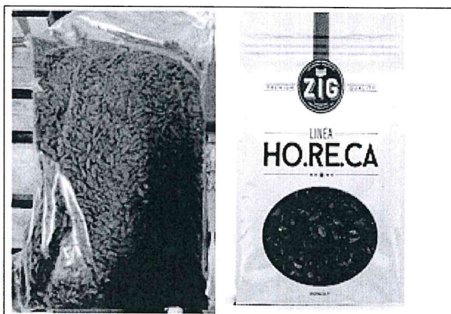
Inserire immagine due: