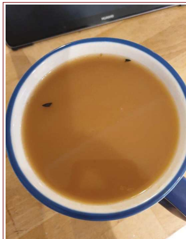
Inserire immagine due: