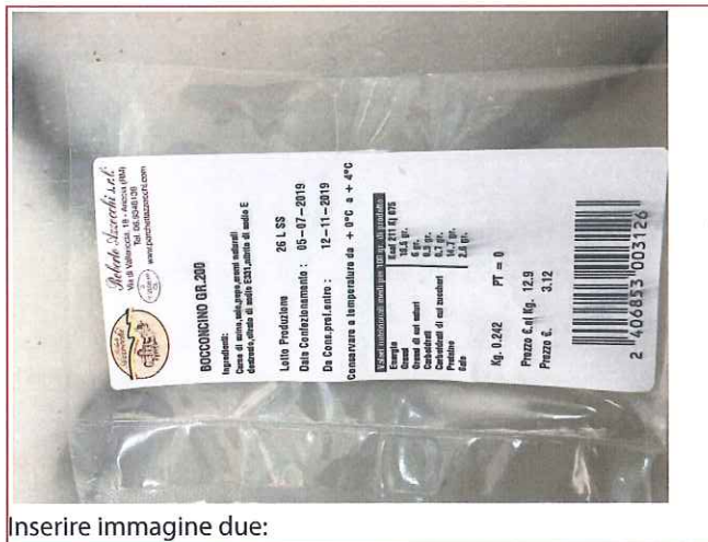
Inserire immagine due: