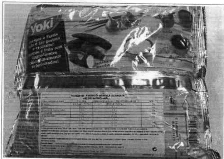
Inserire immagine due: