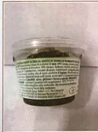
Inserire immagine due: