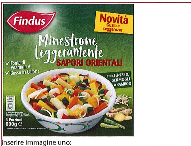
Inserire immagine uno:

Non consumare il prodotto. Restituirlo al punto vendita di acquisto