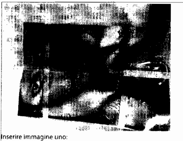
Inserire immagine uno:

IL PRODOTTO NON VA CONSUMATO, MA RESTITUITO NEL PUNTO DI ACQUISTO.