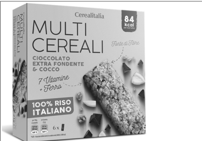
Inserire immagine uno:

I consumatori che hanno acquistato confezioni appartenenti al lotto indicato, sono pregati di non consumare il prodotto e di riportarlo nel punto vendita di acquisto.