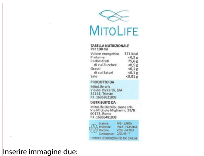
Inserire immagine due: