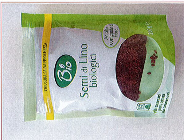
Inserire immagine uno:

LOTTE E TMC: L0109591509 - 15/03/2024; L0109591609 - 16/03/2024; L0105951909 - 19/03/2024; L0109591110 - 11/04/2024; L0109590111 - 01/05/2024; L0109590912 - 09/06/2024; L0109591001 - 10/07/2024