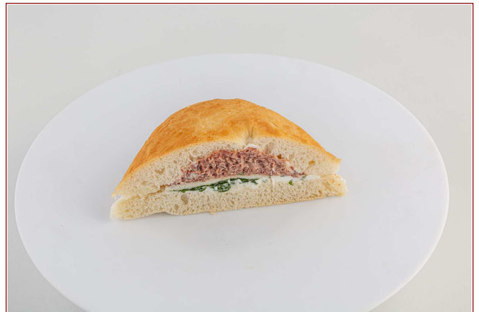
Inserire immagine due: