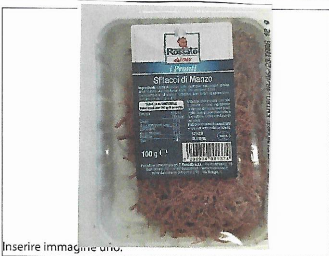
Inserire immagine uno.

Avvertenze: i clienti che avessero acquistato tale prodotto sono pregati di non consumare il prodotto e restituirlo al punto vendita per la restituzione o rimborso entro il 06/08/2023