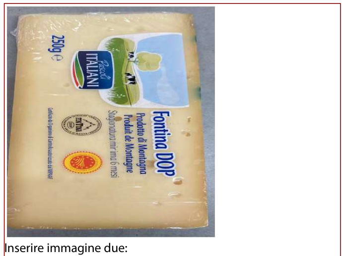
Inserire immagine due: