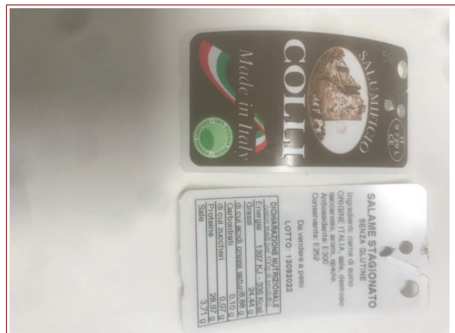
Inserire immagine due: