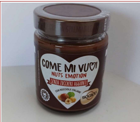
Inserire immagine uno:

Avvertenze: si raccomanda alle persone allergiche alle arachidi di non consumare e restituire al negozio il prodotto con numero di lotto e termine minimo di conservazione indicati. Il prodotto in questione non presenta alcun rischio per i consumatori non allergici alle arachidi.