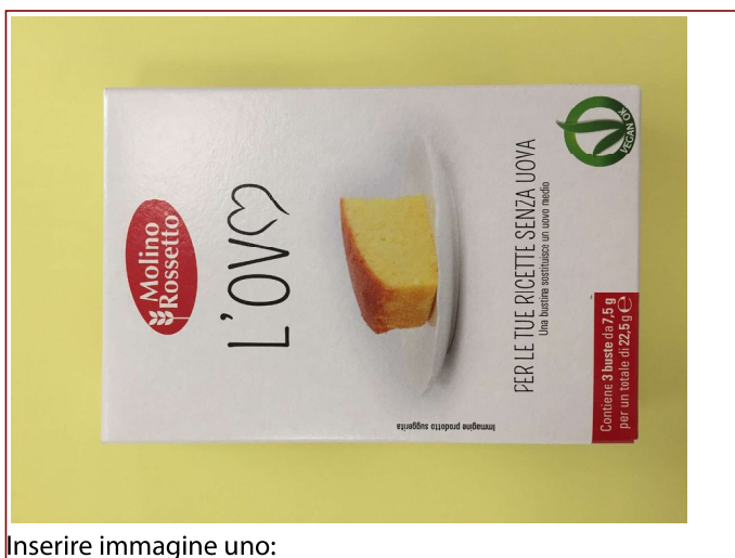
Inserire immagine uno:

Si invitano i Clienti che avessero acquistato il prodotto a non consumarlo ed a riportarlo al punto vendita per il rimborso.