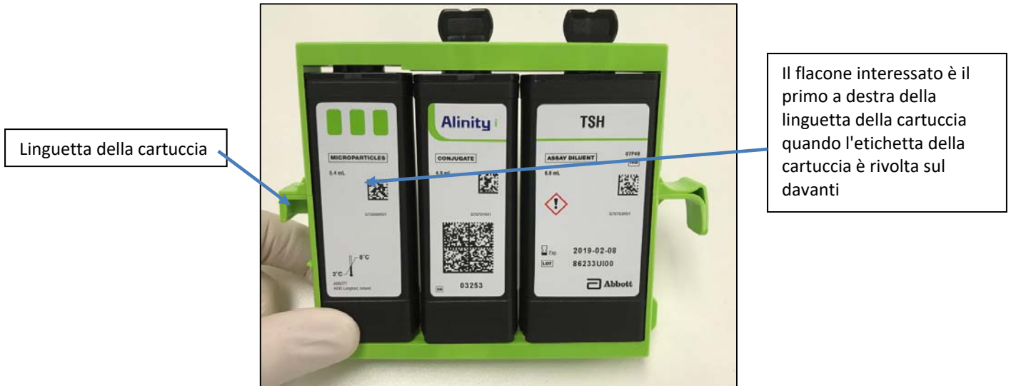
Figure 1: posizione del flacone interessato.