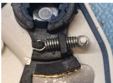
Vecchia piastra posteriore