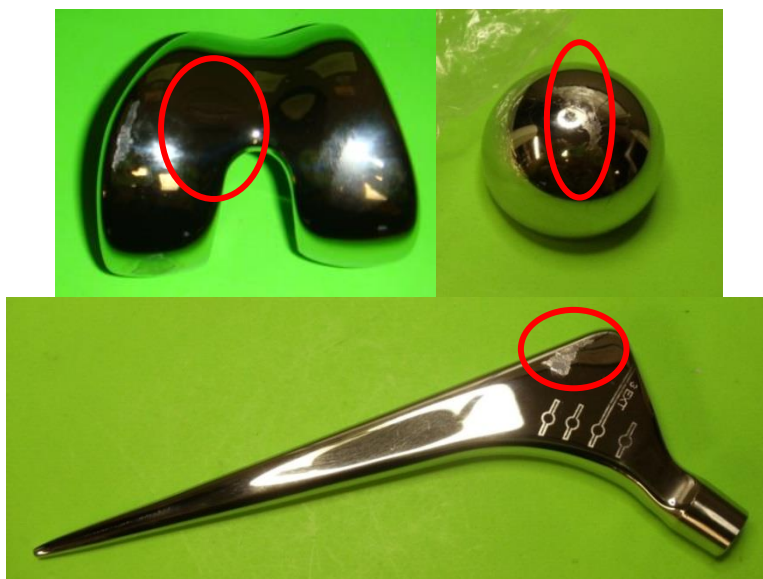
Figura 1: Componente femorale per ginocchio, cotile multipolare per anca e stelo CPT per anca con residui di busta LDPE sull'impianto

Prodotto interessato: Vedere l'Allegato 2 – Elenco dei prodotti interessati