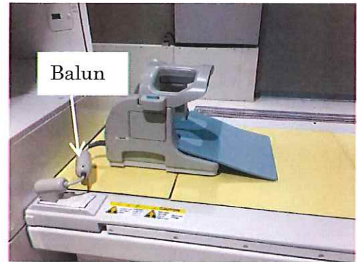
Fig.1 Balun della RAPID C-Spine coil

Hitachi implementerà un'azione correttiva per sostituire l'attuale versione di bilanciatore RAPID C-Spine Coil con una versione migliorata.