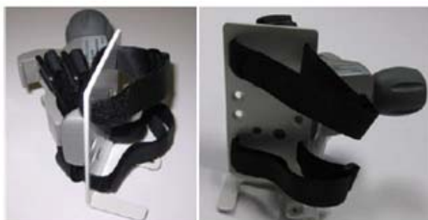
Figura 15-8 Staffa per adattatore di alimentazione dell'EV1000

Figura dal Manuale dell'operatore del sistema EV1000A sull'orientamento dell'adattatore di alimentazione (Figure 15-8 e 15-9)