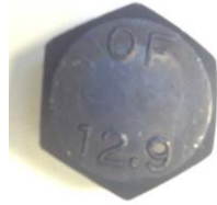
Fig. 1 Bulloni difettosi con "OF" sulla testa.

L'acceleratore digitale lineare non deve essere utilizzato finché non vengono sostituiti i bulloni "OF". Se il sistema in uso utilizza i bulloni corretti, ovvero i bulloni senza il contrassegno "OF", non è necessario implementare il presente ISFN.