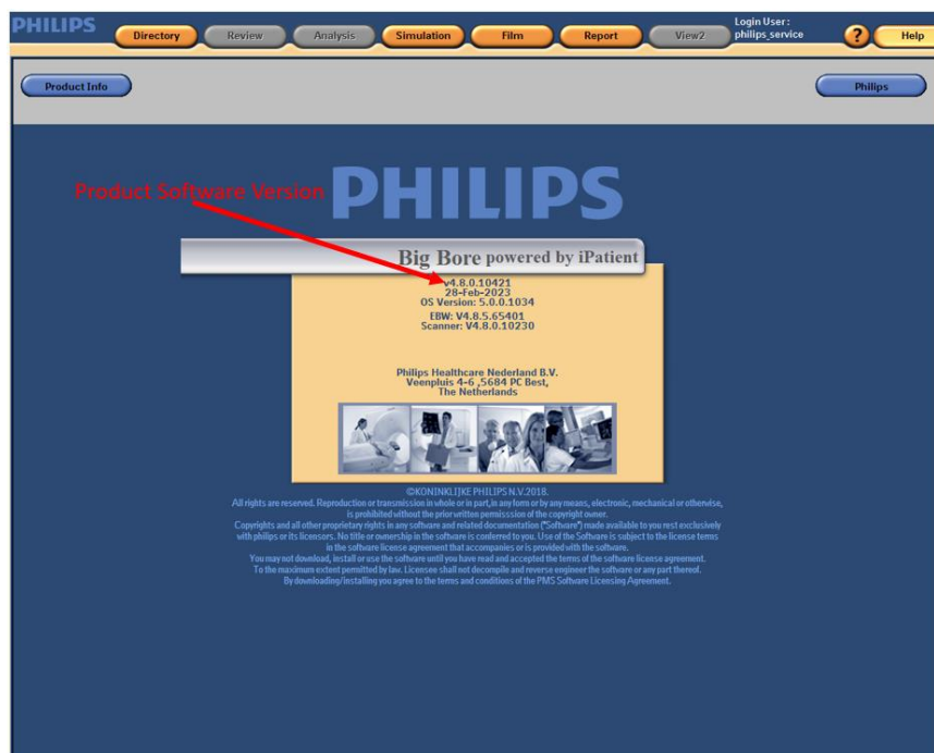
Figura 2. Come esempio viene visualizzata la versione software Big Bore