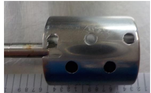
Figura 2: Compress Device Short Anchor Plug

Biomet Orthopedics LLC sta conducendo un'azione correttiva relativa alla sicurezza sul campo di dispositivi medici riguardante i prodotti Compress Device Segmental Anchor Plug e Compress Device Short Anchor Plug indicati nell'elenco dell' Allegato 2 - Elenco dei prodotti interessati . I tappi di ancoraggio interessati presentano potenzialmente delle sbavature metalliche nei fori trasversali del dispositivo che impediscono il passaggio al trapano o ai perni. Da quanto stabilito la questione è stata causata da un aggiornamento del processo produttivo che interessa batch/lotti specifici prodotti prima del 2019. Ad oggi sono stati ricevuti cinque reclami relativi a questa questione.