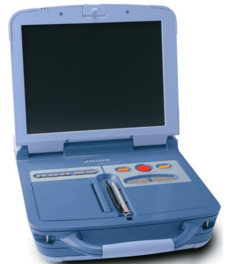
Figura 1. Programmatore ZOOM Modello 3120