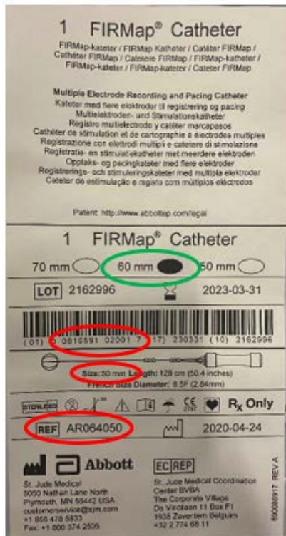
Figura 1: Informazione riportata in etichetta non corretta