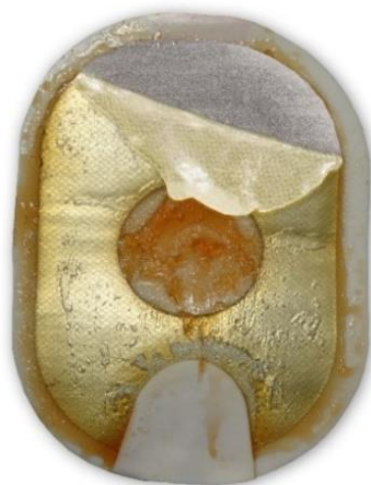
Figura 2: il gel ripiegato e separato può apparire scolorito e/o disciolto.

Azione: applicare gli elettrodi al paziente. Non esitare.