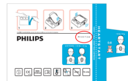
M5072A confezione in alluminio