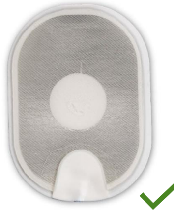
Figura 4: elettrodo normale