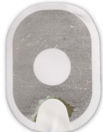
Figura 3: gel quasi completamente separato dal supporto.

Azione: applicare gli elettrodi al paziente. Non esitare.