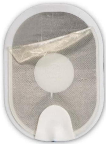
Figura 1: gel separato che si è ripiegato su se stesso quando è stato staccato.

È inoltre possibile che il gel si separi quasi completamente dal supporto in schiuma/stagno quando viene staccato (vedere la Figura 3 .) A causa del ridotto volume di superficie del gel a contatto con la pelle, potrebbe verificarsi un arco elettrico quando viene erogata una scarica, con possibili ustioni al paziente, oppure il DAE potrebbe non essere in grado di erogare alcuna scarica attraverso gli elettrodi. L'installazione una cartuccia di elettrodi di ricambio (se disponibile) o l'esecuzione della RCP in attesa dell'arrivo del personale del servizio di emergenza sanitaria può ovviamente causare un ritardo nell'erogazione della terapia. Ai fini di un confronto, la Figura 4 mostra un elettrodo normale. Indipendentemente dallo stato dell'elettrodo, seguire i messaggi vocali perché il DAE guida l'utente nell'esecuzione di tutte le operazioni necessarie.