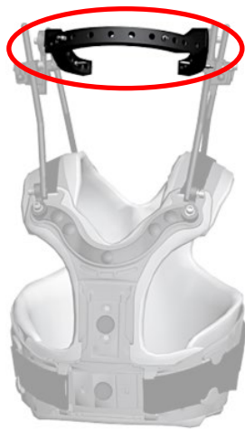
PHOTO DELLA CONFEZIONE DEL DISPOSITIVO