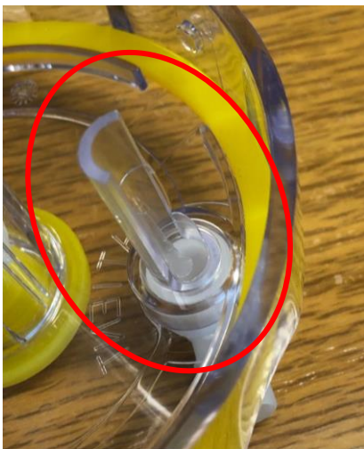
1 Coperchio del contenitore difettoso