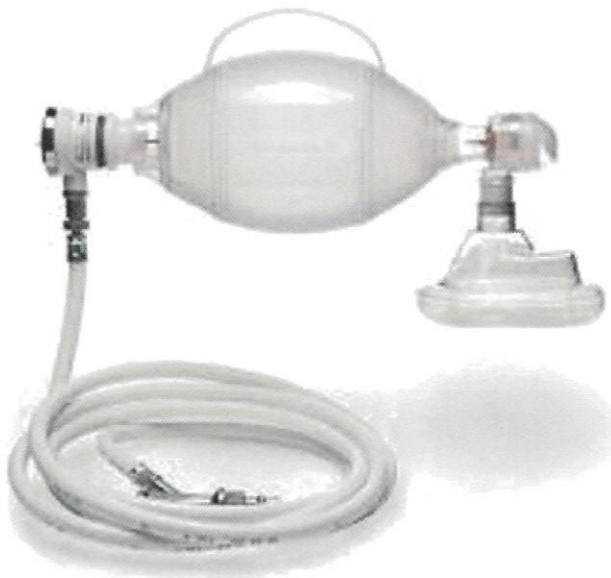
Ambu® SPUR® II Per Valvola a Domanda