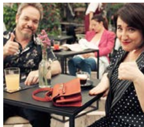
Screenshot della Campagna

Con la consulenza tecnica del TAS ed in collaborazione con la DGCOREI, è stato realizzato uno spot televisivo ed uno radiofonico sull'allattamento che sono stati veicolati, da luglio a settembre 2019, nei canali RAI e Mediaset. Lo spot, ha come obiettivo quello di sensibilizzare le donne sull'importanza di tale pratica e sulla naturalezza del gesto, divulgando il messaggio che ogni donna deve sentirsi libera di allattare anche in pubblico o nei luoghi di lavoro, "sempre e ovunque", come recita lo spot. "È naturale!" I testimonial scelti sono i due famosi comici Nuzzo&DiBiase.