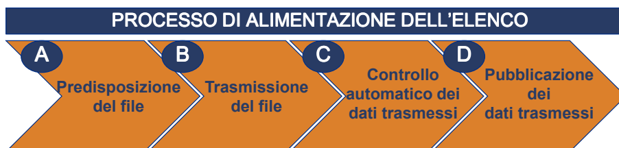
Figura 1: Processo di alimentazione dell'elenco

In particolare nel seguito del documento verranno descritte le attività che consentono la corretta alimentazione dell'elenco indicate nel grafico seguente.