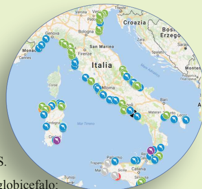
Mappa 1: distribuzione geografica degli spiaggiamenti su cui sono intervenuti gli IIZZSS.

Gli IIZZSS territorialmente competenti sono intervenuti complessivamente su un totale di 106 soggetti su 212 spiaggiati (50%), come dettagliato in Tabella n. 3.