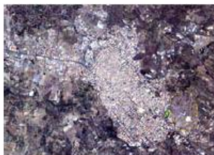
Veduta aerea di Biancavilla (a sud-est la Cava di Monte Calvario)

Percorsi di ricerca, interventi di sanità pubblica e di promozione della salute