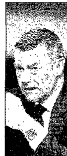
LA BATTAGLIA DEL MINISTRO

«Le donne che dopo la somministrazione a casa si sentono male, saranno curate in ospedale»