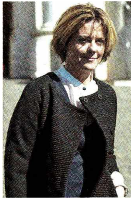
IL RAPPORTO Sopra, l'inchiesta su quanto pagano gli italiani di ticket per analisi e visite specialistiche pubblicata ieri su Repubblica: l'esborso pro capite varia molto da regione a regione. A sinistra, il ministro della Salute Beatrice Lorenzin