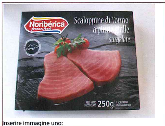
Inserire immagine uno:

Si prega di non consumare il prodotto e di riportarlo presso il punto vendita di acquisto. Ogni confezione resa verrà rimborsata. Il lotto indicato è stato distribuito solo ai punti vendita del Nord Italia.