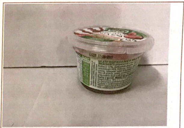
Inserire immagine due: