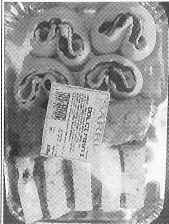
Inserire immagine due: