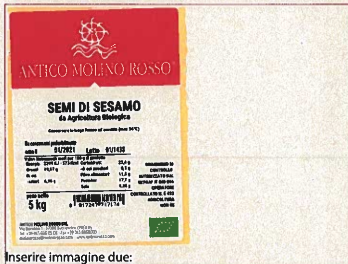
Inserire immagine due: