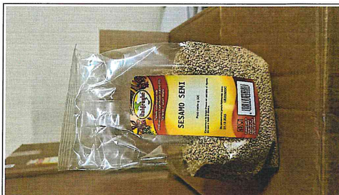
Inserire immagine due: