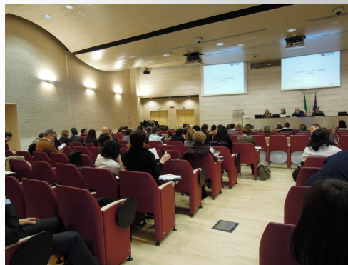
Ministero della salute—Auditorium

L'evento, organizzato nell'ambito del progetto Mattone Internazionale - MI, vede il coinvolgimento di alcuni esperti dell' Organizzazione per la Cooperazione e lo Sviluppo Economico (OCSE) per un'analisi approfondita e dibattito su alcuni temi prioritari relativi alla salute e ai sistemi sanitari in Europa, e nello specifico: