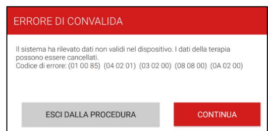
Figura 1 - Schermata dell'errore di convalida

Questo comportamento si verifica ed è rilevato in ambiente ospedaliero dove il paziente è affidato alle cure dell'operatore sanitario. Se si presenta l'errore di convalida (come illustrato) con codice di errore (01 00 85) (04 02 01) (03 02 00) (08 08 00) (0A 02 00) prima di installare l'aggiornamento dell'applicazione software Intellis modello A710 versione 1.3.130, selezionare l'opzione "continua". Se viene selezionato "esci dalla procedura", ristabilire la comunicazione e quando viene visualizzato il messaggio "errore di convalida" selezionare "continua" (figura 1).