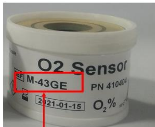
Figura 5: Numero di parte del sensore dell'ossigeno: 6600-1278-600 Figura 6: Numero di parte del sensore dell'ossigeno: M-43GE