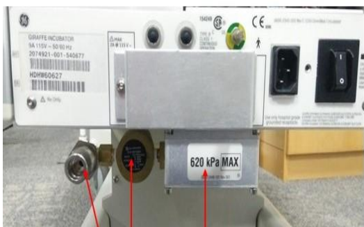
Figura 2: Il modulo Servo ossigeno è installato