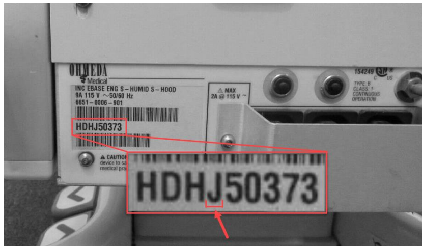
Figura 1: Etichetta del numero di serie, posizione della 4ª lettera