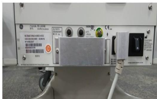
Figura 3: Il modulo Servo ossigeno NON è installato