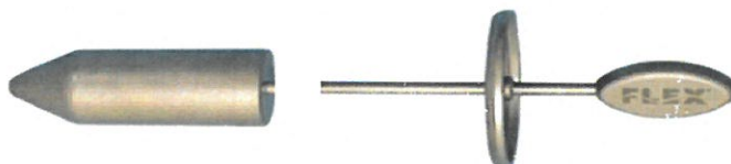
Obturator with failed weld (cone separated from shaft)

MOTIVO: Potenziale distacco del manico del Dilatatore dal cono con possibilità del cono di rimanere nel retto del paziente.