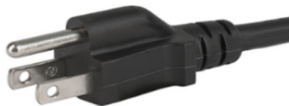
Figura 3: NON DEVE ESSERE UTILIZZATA la spina di tipo B in Thailandia, Perù, Brasile.