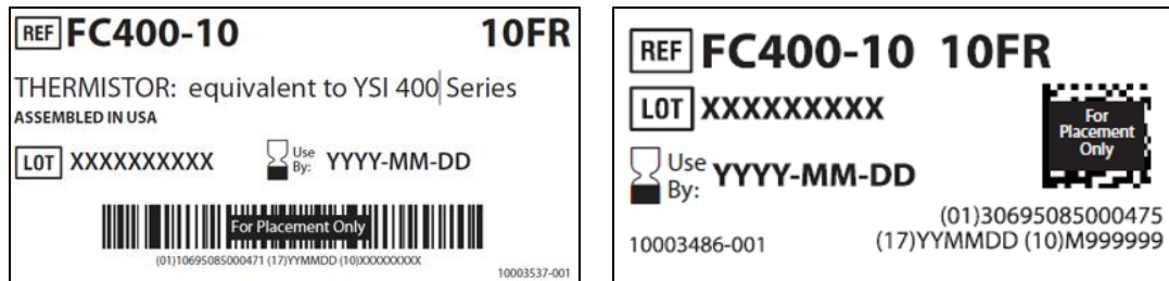
Figura 2 - Etichettatura del prodotto interessato