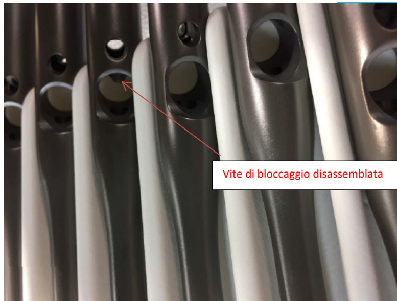
Vite di bloccaggio disassemblata

Zimmer Biomet sta conducendo un'azione di richiamo per dispositivi medici riguardante lotti specifici dei chiodi per fratture dell'anca Affixus. Nel corso del processo di revisione è stato rilevato che il gruppo vite di bloccaggio più guida, progettato per avere un accoppiamento ad interferenza (press-fit), non era più nella posizione di installazione. Ciò potrebbe impedire l'assemblaggio del prodotto con la vite di accoppiamento e la mascherina di centratura. Di conseguenza, si stanno richiamando/ritirando i prodotti già distribuiti, che sono stati soggetti a questo processo di revisione.