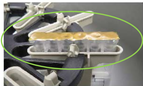
Cassette adeguatamente positionata nel Supporto della Centrifuga