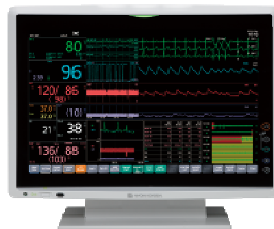
Life Scope G9 (CSM-1901)

Assicurarsi che tutti i responsabili del controllo del defibrillatore e potenziali utilizzatori del dispositivo sia informati riguardo a questa INFORMAZIONE di SICUREZZA!